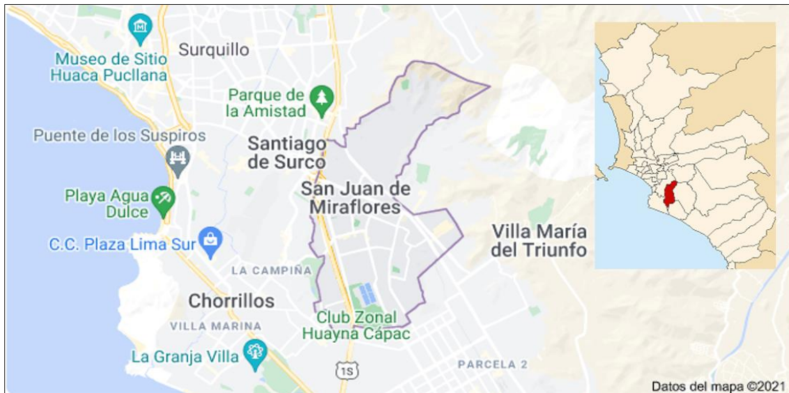
Figura N°1: Ubicación geográfica del distrito

El distrito de San Juan de Miraflores está ubicado en la zona sur de Lima Metropolitana. Cuenta con una superficie de 23.98 km 2 y su altitud media es de 141 m.s.n.m.